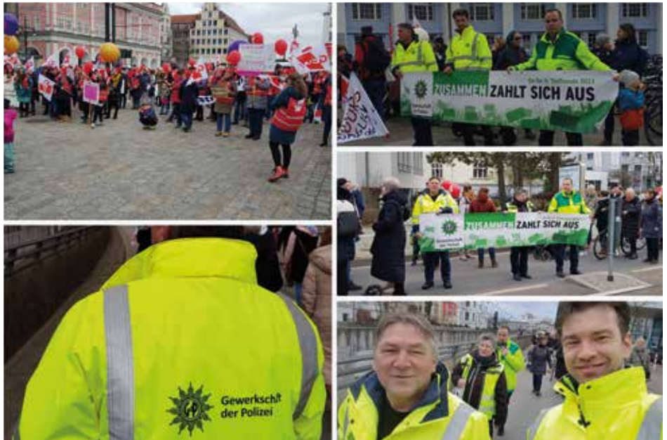
Collage: GdP MV